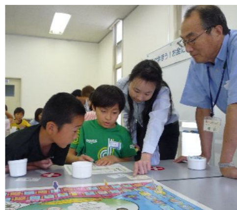
FPから「手ほどき(?)」を受けながらのお金のやりくりと使い方を学習中。