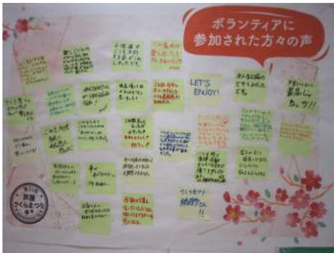
4月7日(日) 実行委員会振り返りと ボランティアの意見